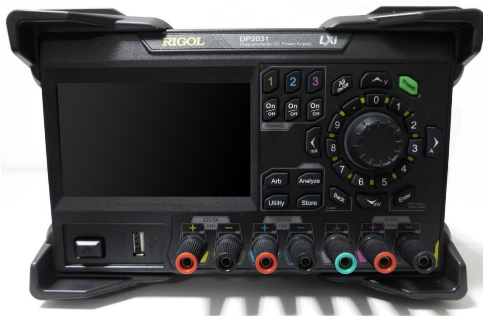
Рисунок 1 - Передняя панель источников Rigol DP2031